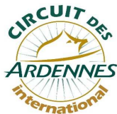
Tableau d'honneur après 3ème étape Carignan - Saint-Walfroy